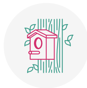
Aménagement biodiversité toute l'année