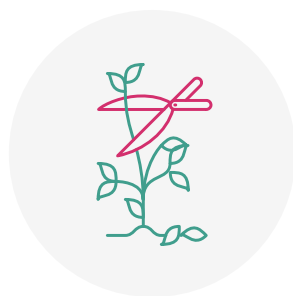
Taille de haie indigène du 01/09 au 31/03