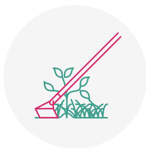
Désherbage de haie indigène mai/juin et septembre/octobre