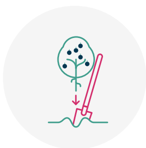
Plantation d'arbres fruitiers indigènes du 15/11 au 15/03