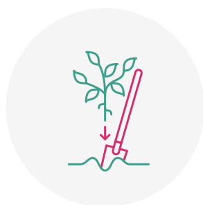
Plantation de haie indigène du 15/11 au 15/03