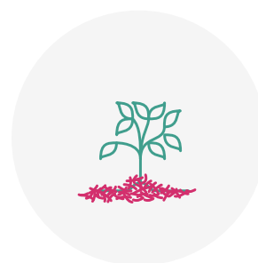
Paillage du 01/11 au 31/03