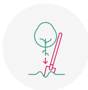
Plantation d'arbres non fruitiers indigènes du 15/11 au 15/03