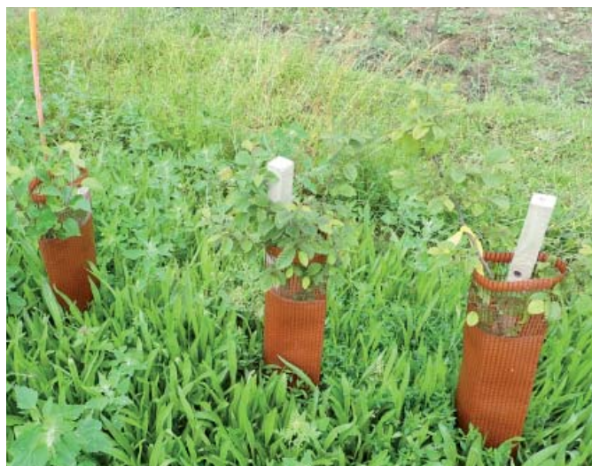
Photo de gauche : couvert de plantain lancéolé et protections individuelles pour vigne.

PS : respecter les densités de semis, surtout pour la phacélie, sinon elle peut faire concurrence aux jeunes plants pour la lumière