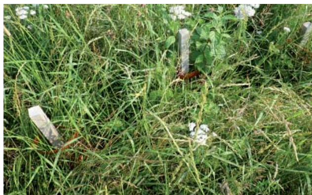
Photo ci-dessous : zone témoin sans couvert et sans dégagement (arbustes noyés dans les adventices).